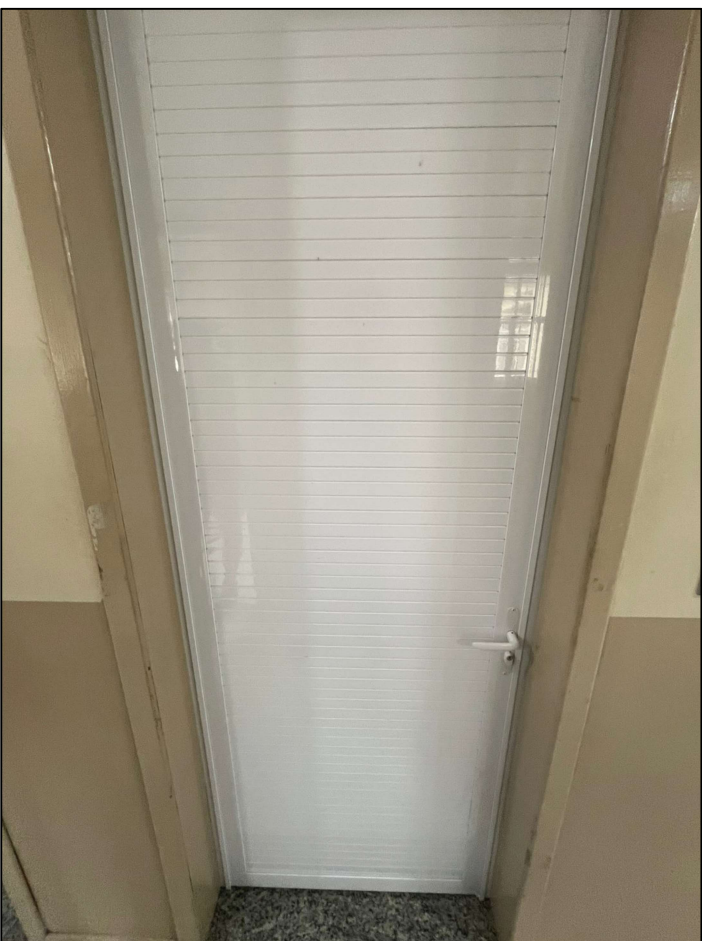
Referência das portas em alumínio, casa da cidadania.